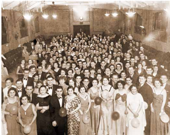
דער „קדימה“-באַל, 1936

אַ סבֿראַ, אַז דאָס וואָרט „פֿאַרויס“ האָט ניט געקלונגען שיין גענוג אויך אין די אויערן פֿון די מענטשן, וועלכע האָבן מיט אַ יאָרהונדערט צוריק